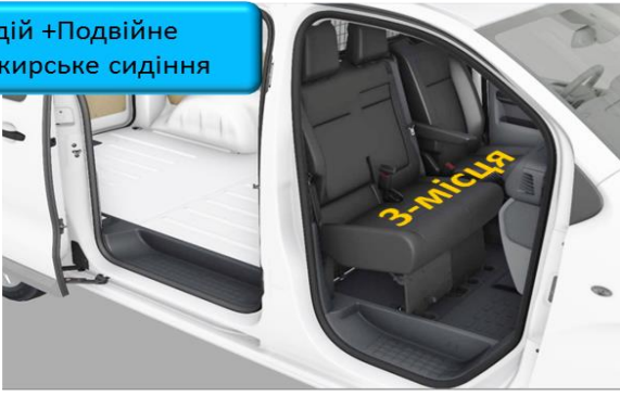
Водій + Подвійне Пасажирське сидіння