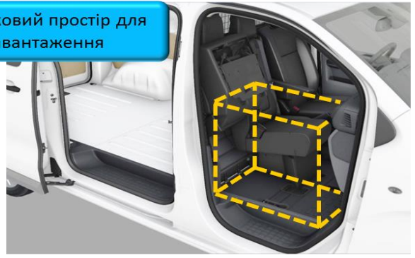
Додатковий простір для завантаження